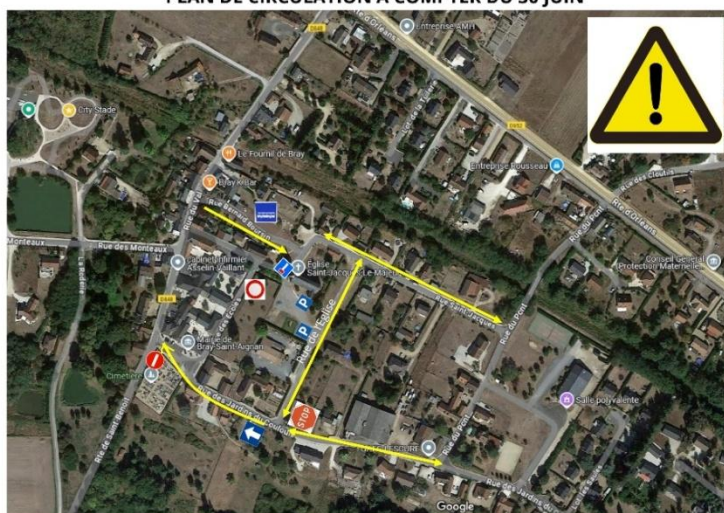
PLAN DE CIRCULATION A COMPTER DU 30 JUIN

Rappel : non-respect du sens interdit !!! 135 euros d'amende – 4 points sur permis. Responsabilité pleine et entière en cas d'accident !!!